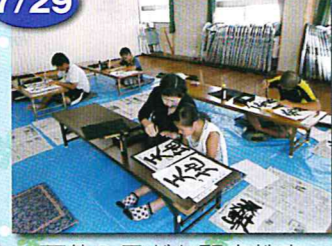
夏休み子ども習字教室