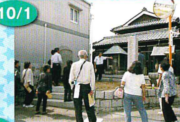
県外研修 渋染一揆