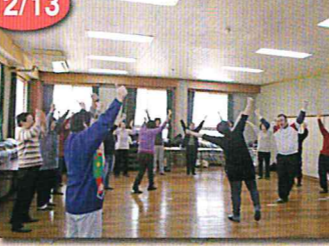
ラフターヨガ教室～笑いとヨガの呼吸法で心身ともに元気にスッキリ！～