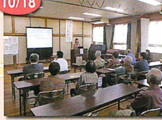
天気予報から気象災害防止への心得について