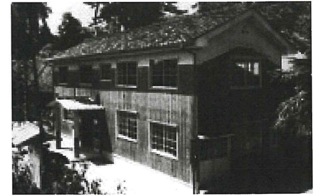
昭和31年から昭和49年まで中央公民館として現在の消防器庫に位置していた。