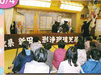
森林セラピー&人形浄瑠璃鑑賞