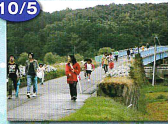
青島たんけんたい