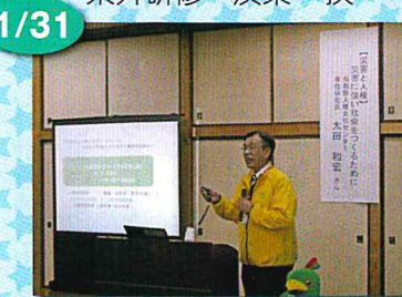
講演会：災害と人権