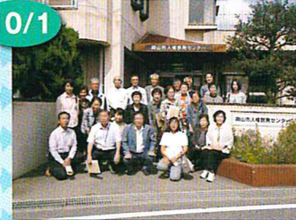
県外研修 集合写真