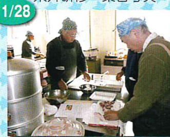
モンゴル料理教室