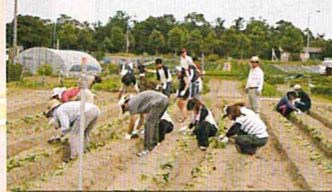
こやま農園 さつまいも苗植え