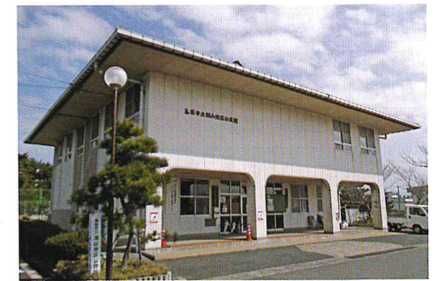
昭和50年から現在に至るまで湖東中学校グラウンド裏に位置している。