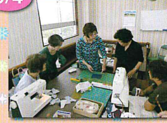
ネクタイリフォームバック作り